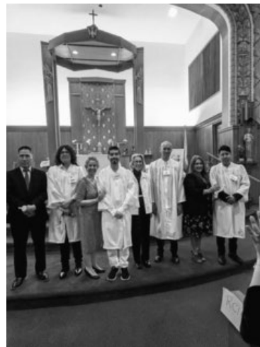
Received into Full Communion