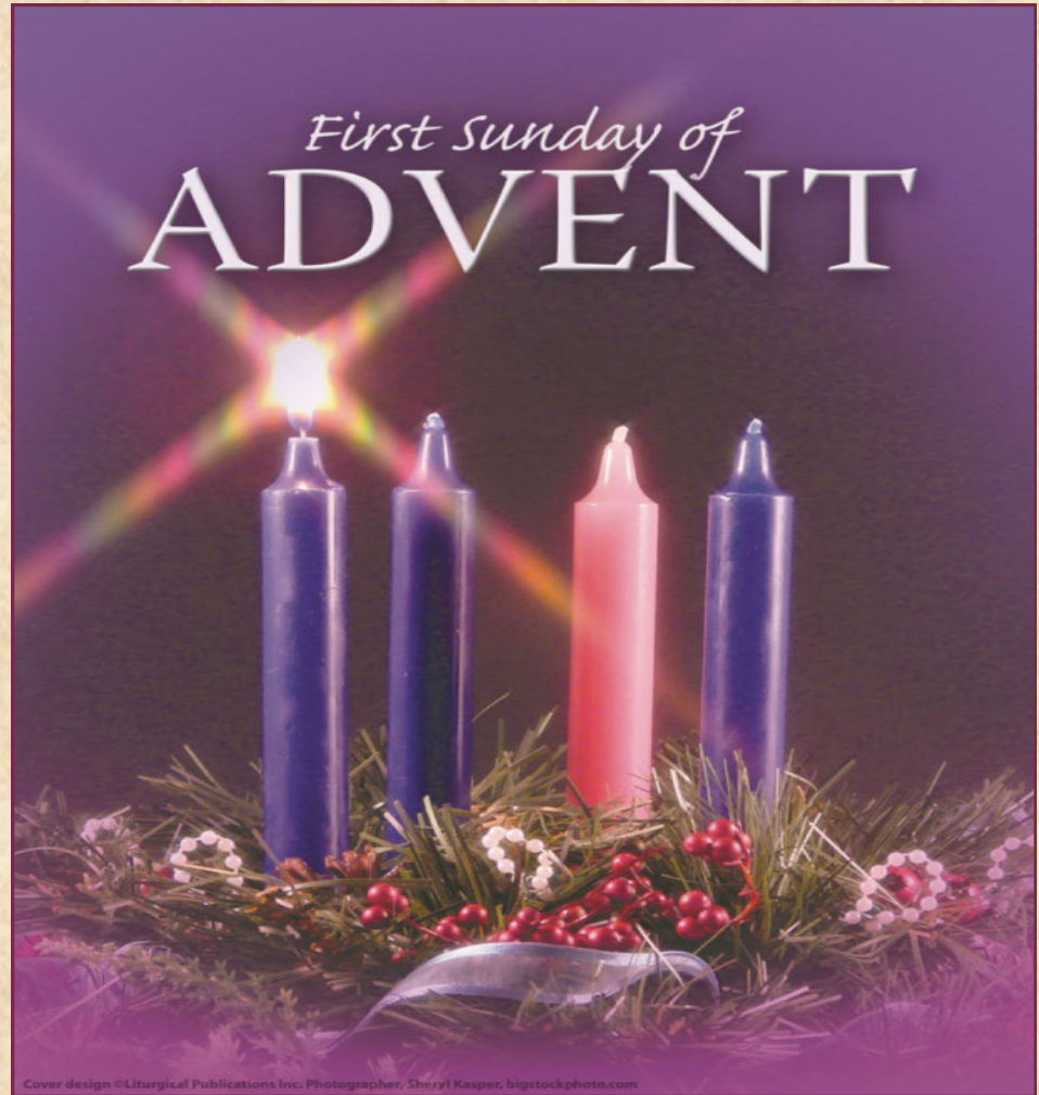
Cover design ©Liturgical Publications Inc.